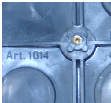
Scatola 1014 con inserto in ottone fuori produzione