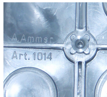
Nuova scatola 1014 senza inserto in ottone. Su queste scatole è possibile montare il coperchio 1017 con barra filettata e 1025 con piedini