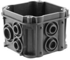
372 101 747 - 1004 (dazu passt die Dichtplatte 372 800 007 - 1004/3-1)

... seit 1966 - mit verbesserter Geometrie für den Einbau in brennbare Wände und Hohlwände