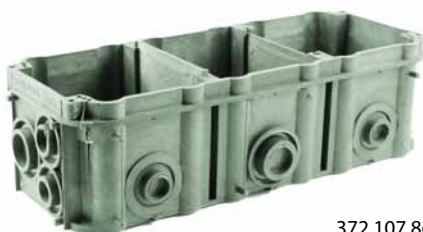
372 107 867 - 1066-B